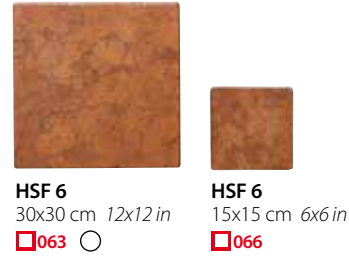
HSF 6 30x30 cm 12x12 in 063 HSF 6 15x15 cm 6x6 in 066