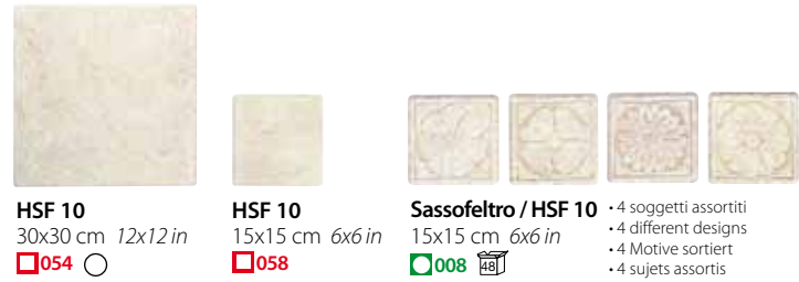
HSF 10 30x30 cm 12x12 in 054 HSF 10 15x15 cm 6x6 in 058 Sassofeltro / HSF 10 15x15 cm 6x6 in 008 • 4 soggetti assortiti • 4 different designs • 4 Motive sortiert • 4 sujets assortis