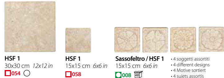
HSF 1 30x30 cm 12x12 in 054 HSF 1 15x15 cm 6x6 in 058 Sassofeltro / HSF 1 15x15 cm 6x6 in 008 • 4 soggetti assortiti • 4 different designs • 4 Motive sortiert • 4 sujets assortis