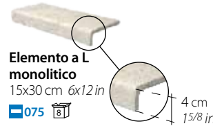
Elemento a L monolitico 15x30 cm 6x12 in 075

Disponibili nei colori: - Available on colours: - Formteile in den Farben: - Disponibles dans le couleurs: - HSF 1 - HSF 10 - HSF 6