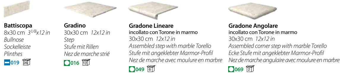
Battiscopa 8x30 cm 3 1/8 x 12 in Bullnose Sockelleiste Plinthes 019 Gradino 30x30 cm 12x12 in Step Stufe mit Rillen Nez de marche strié 016 Gradone Lineare incollato con Torone in marmo 30x30 cm 12x12 in Assembled step with marble Torello Stufe mit angeklebter Marmor-Profil Nez de marche avec moulure en marbre 049 Gradone Angolare incollato con Torone in marmo 30x30 cm 12x12 in Assembled corner step with marble Torello Ecke Stufe mit angeklebter Marmor-Profil Nez de marche angulaire avec moulure en marbre 069

Disponibili nei colori: - Available on colours: - Formteile in den Farben: - Disponibles dans le couleurs: - HSF 1 - HSF 10