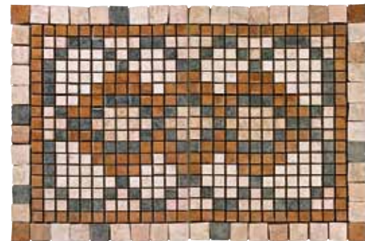
Tappeto Sassofeltro 60x90 cm 24x36 in 520