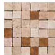
Mosaico Sassofeltro 30x30 cm 12x12 in 061